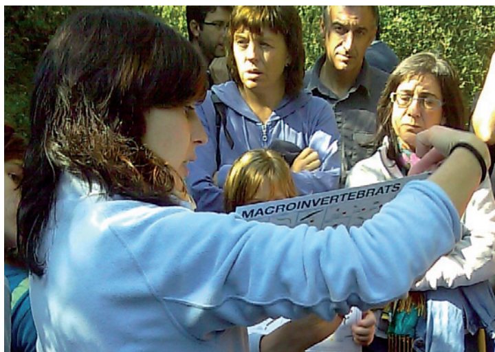
El participants de la sortida naturalista i formativa valoren l'estat de salut de la riera de Martinet amb el Projecte Rius.